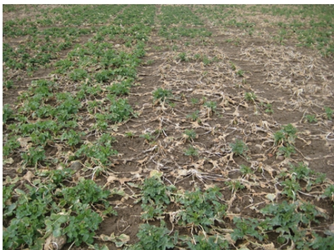
Attēls Nr. 2. RAPOOL (pa kreisi) pret konkurentu (pa labi)

Pateicoties aizsargājošajai sniega segai, lieli ziemas postījumi netika konstatēti. Mikroklimata apstākļu ietekmē vienu pārbaudes vietu ( Vadstena ) no valsts šķirņu izmēģinājumu tīkla (OS7-27) Zviedrijas vidienē gan skāra nopietni postījumi. Oficiālais ziemošanas laikā bojā gājušo augu novērtējums vēlreiz uzsver jau aizmirsto izturību pret salu nozīmi. RAPOOL joprojām pirmajā vietā ir izvēle pret postījumiem ziemā, kas pamatojas uz augstu uzticamības pakāpi un pielāgotiem risinājumiem.